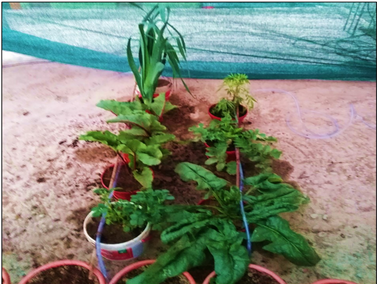
Figura 2. hortalizas producidas mediante el uso del agua destilada de mar de Ilo con energía solar.

En la Figura 2 se muestra el crecimiento del poro, al inicio tuvo una altura de 10 cm y al final luego de 16 semanas (112 días) tuvo una altura de 81 cm y su peso fue de 146,6 g en promedio; la betarraga se cosechó a las 12 semanas (84 días), tuvo un diámetro del producto de 5 cm con un peso de 60,8 g en promedio; el nabo se cosechó a las 10 semanas (70 días), tuvo una altura del producto de 19 cm y peso de 88 g en promedio. En la figura 2 se muestran las hortalizas producidas mediante el uso del agua destilada de mar de Ilo con energía solar. Como era época de invierno, en todos los casos se regó con 500 ml tres veces por semana en cada macetero por cultivo haciendo un total de 1500 ml de agua destilada de mar por semana.