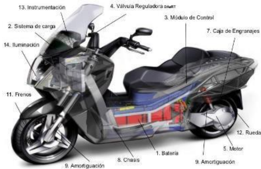
Figura 1. Componentes básicos de una motoneta eléctrica. Fabre, (2018)

Motonetas eléctricas Figura 1, según Zúñiga (2021) el uso de motocicletas eléctricas es una opción viable para combatir los problemas de contaminación, y hoy en día, muchos países europeos desarrollados, como Alemania, Italia y Francia, promueven su uso. En este sentido, Ecuador también ha avanzado en este aspecto, ya que día a día circulan una gran cantidad de motocicletas eléctricas en cada una de las ciudades. En otras palabras, la motocicleta eléctrica es un sistema alternativo de movilidad vehicular con muchas ventajas, especialmente desde el punto de vista de la movilidad sostenible.