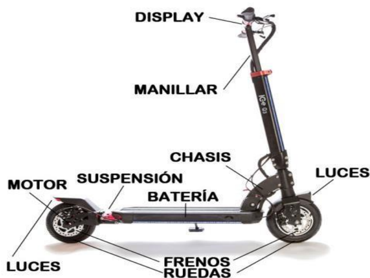
Figura 3. Partes de un monopatín eléctrico. Amado y Boadas, (2024)

El sistema de transmisión: Incluye los motores y determina la longitud del eje motriz (trasero). Si se elige una transmisión por cadena dentada, se necesitará un eje más largo para acomodar las poleas necesarias.