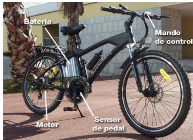
Figura 2. Partes de una bicicleta eléctrica. Ordoñez, (2016)

Monopatines eléctricos Figura 3, de acuerdo con Amado y Boadas (2024), los monopatines eléctricos conservan los mismos elementos y características que los tradicionales. Sin embargo, algunos de estos elementos han sido modificados y se han añadido componentes adicionales. Los tres elementos que distinguen las dos tipologías de monopatines son: