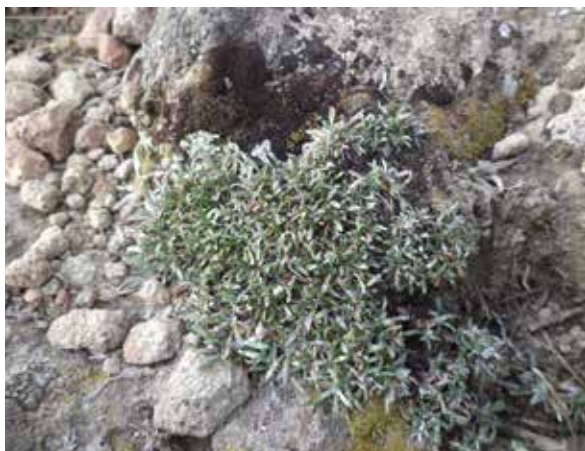
Figura 4. Detalle de Belloo kunthiana (DC.) Anderb. & S.E.Freire, desarrollándose típicamente en rocas.

La fisionomía de la comunidad es de herbáceas pequeñas arrosietadas-pulviformes y casmofíticas no muy abundantes, por lo general en fisuras y debajo de rocas. El estrato arbustivo está bien representado con arbustos densos de Nordenstamia longistyla y Lupinus paniculatus , arbustos dispersos de Baccharis tricuneata , Bomarea dulcis , Chuquiraga rotundifolia y Ephedra rupestris , Parastrephia lucida y Tetraglochim cristatum , Salpichroa glandulosa representa el único arbusto colgante y se desarrolla preferentemente bajo sombra en fisuras de rocas y dentro de arbustos