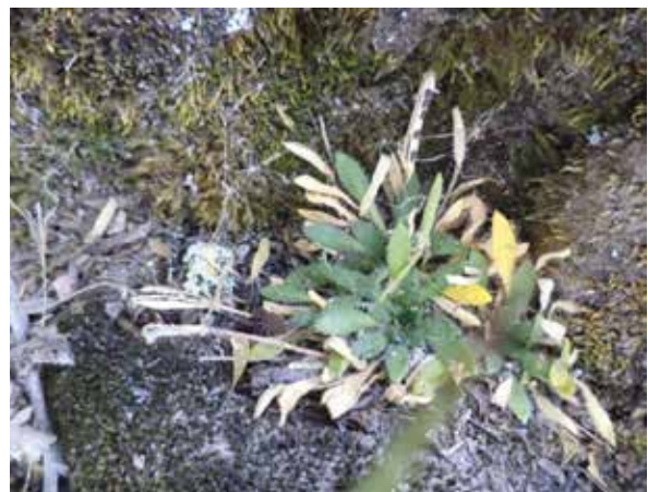
Figura 5. Detalle de Brayopsis calycina (Desv.) Gilg & Muschl. creciendo entre abundantes musgos a 3900 m.

La asociación se desarrolla en suelos francos y ligeramente arenosos entre 3850-4000 m que en su buena parte se encuentra expuesto a pastoreo (llamas y ovejas), también crece cerca de suelos con materia orgánica acumulada (ramas y hojas secas) protegida por arbustos medianos y altos, en estos ambientes se apreció una considerable variedad de insectos (Formicidae, Ortóptera y Coleóptera), rastros de mamíferos andinos: Conepatus chinga "zorrino" o "añazo", Galictis cuja "hurón", Hippocamelus antisensis "taruca", Lepus europaeus "liebre europea", Lycapopex culpaeus "zorro andino", Oreailurus jacobita "gato andino" o "leoncillo", Puma concolor "puma" y especies no identificadas de ratones y aves que habitan las grandes rocas y conviven con la asociación.