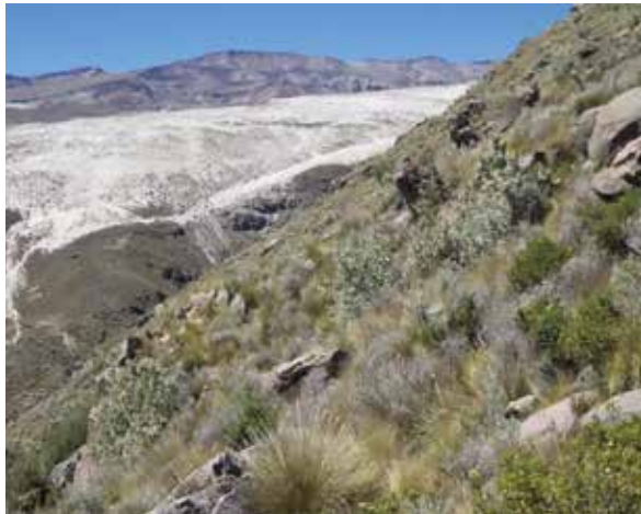
Figura 2. Paisaje de la asociación Festuco dolichophyllae - Nordenstamietum longistylae Chicalla 2017 asoc. nov. en laderas del Cerro Sayhuane a 3900 m.