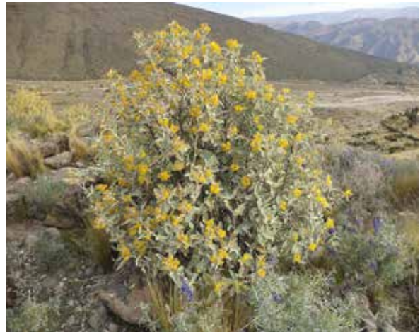
Figura 3. Porte arbustivo de Nordenstamia longistyla (Greenm & Cuatrec.) B. Nord. en el Cerro Challapatja a 3860 m.

Esta comunidad es zonal y transitoria entre arbustales o matorrales perennes de puna subhúmeda posiblemente (por las especies diferenciales encontradas) de la Alianza Mutisio acuminatae-Ophryosporion peruviana Galán de Mera & Cáceres in Galán de Mera, Rosa & Cáceres 2002 (Clase BACCHARIDETEA LATIFOLIAE Lauer, Rafiqpoor & Theisen 2001; Orden Mutisio acuminatae-Baccharidetalia latifoliae Galán de Mera & Cáceres in Galán de Mera, Rosa & Cáceres 2002) y los pajonal-matorrales o pajonal-tolares perennes de puna seca-subhúmeda pertenecientes posiblemente a la Asociación Parastrephio lucidae-Festucetum orthophyllae (Clase Calamagrostietea Vicunarum Rivas-Martínez & Tovar 1982, Orden Parastrephietalia lepidophyllae Navarro 1993, Alianza Azorello compactae-Festucion orthophyllae Galán de Mera, Cáceres & González 2003.