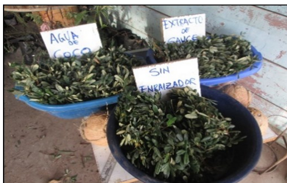
Figura 1. Esquejes fueron puestos en dos recipientes.

En el trasplante se utilizó un repicador con el cual se realizaron hoyos de aproximadamente 5 cm de profundidad para el anclado del esqueje. El sistema de riego que se utilizó fue por aspersión en la primeras semanas se regó dos veces al día para alcanzar la máxima unidad, después de la segunda semana se regó cada dos días un solo riego en la hora de la mañana.