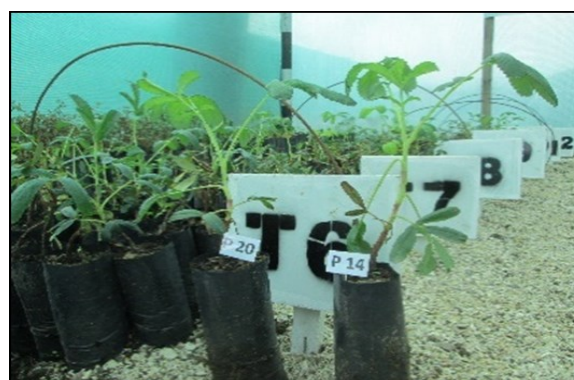
Figura 2. Distribución de tratamientos y su riego.

En el trasplante se utilizó un repicador con el cual se realizaron hoyos de aproximadamente 5 cm de profundidad para el anclado del esqueje. El sistema de riego que se utilizó fue por aspersión en la primeras semanas se regó dos veces al día para alcanzar la máxima unidad, después de la segunda semana se regó cada dos días un solo riego en la hora de la mañana.