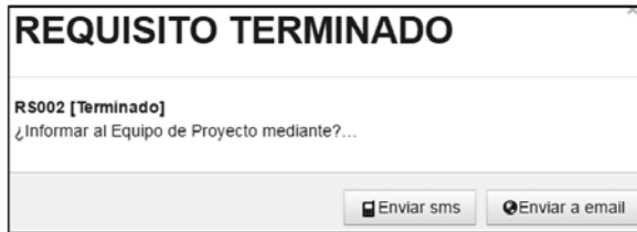
Figura 5. Notificación de SMS al equipo

Cuando un desarrollador desea notificar avance de un requisito presiona el botón SMS y luego abre una ventana modal como se muestra en la fig. 5, donde tiene la opción de seleccionar la notificación SMS masiva a todos los miembros del equipo (número de celular) con información como: nombre del proyecto, nombre del requisito, avance del requisito y nombre del desarrollador que envía la notificación.